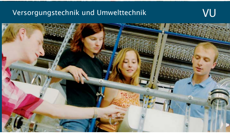
Versorgungstechnik und Umwelttechnik VU